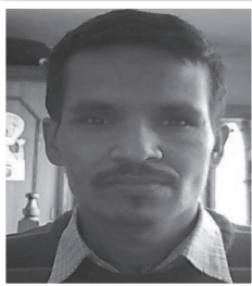
❖ अरुण नदी खत्री